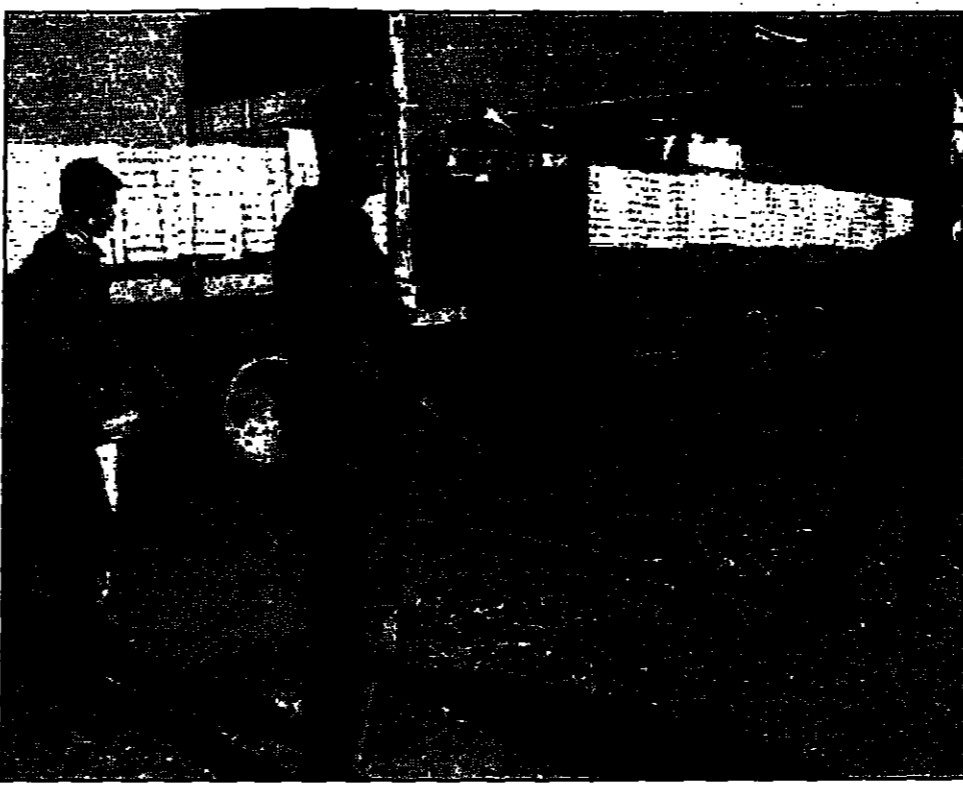
شباطان فلسطينيان يرافقان شاحنتين للمستوطنين منعتا من الوصول إلى مستوطنة تسلايم

القدس - غزة - أريحا - واشنطن - قال وزير الخارجية الإسرائيلي إسحاق رابين في بيان له اليوم إن إسرائيل ستتمسك بمواقفها بشأن المعتقلين الفلسطينيين الذين احتجزتهم في الضفة الغربية المحتلة، وذلك في ظل استمرار المفاوضات مع منظمة التحرير الفلسطينية. وقال رابين في بيان له اليوم إن إسرائيل ستتمسك بمواقفها بشأن المعتقلين الفلسطينيين الذين احتجزتهم في الضفة الغربية المحتلة، وذلك في ظل استمرار المفاوضات مع منظمة التحرير الفلسطينية. وقال رابين في بيان له اليوم إن إسرائيل ستتمسك بمواقفها بشأن المعتقلين الفلسطينيين الذين احتجزتهم في الضفة الغربية المحتلة، وذلك في ظل استمرار المفاوضات مع منظمة التحرير الفلسطينية.